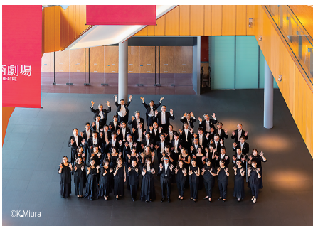
高崎芸術劇場 大劇場 Takasaki City Theatre Grand Theatre

1995年京都生まれ。7歳よりヴァイオリンを始め、数々の国際コンクールで受賞。国内外の主要オーケストラと共演し、協奏曲からリサイタルまで幅広く活躍。2015年出光音楽賞、2016年青山音楽新人賞、2018年大阪文化祭奨励賞を受賞。近年はCD録音やメディア出演も精力的に行い、2024年にはサントリーホールで一晩に3つの協奏曲を演奏し、注目を集めた。使用楽器は宗次コレクションより貸与されている1678年製ニコロ・アマティ。