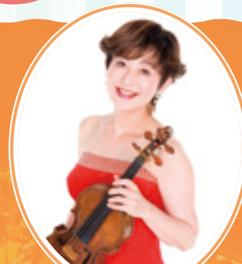
ヴァイオリン 大谷 康子 ＊