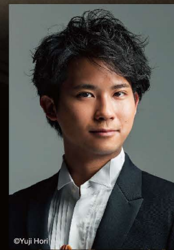
三浦文彰 * (ヴァイオリン)