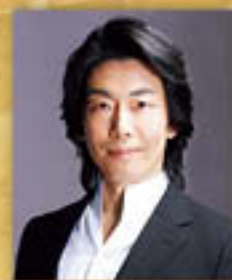
ナレーター 彌勒 忠史

ストラヴィンスキー／兵士の物語 【全曲】(C.F. ラミューズ台本 日本語上演 / 西久美子訳) L' HISTOIRE DE SOLDAT (The Soldier's Tale)