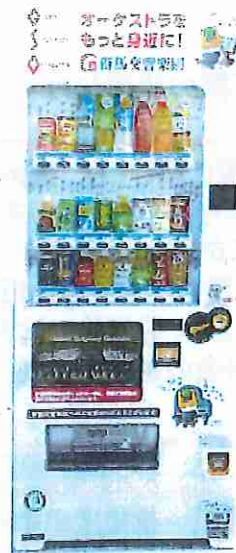
麒麟自販機デザイン